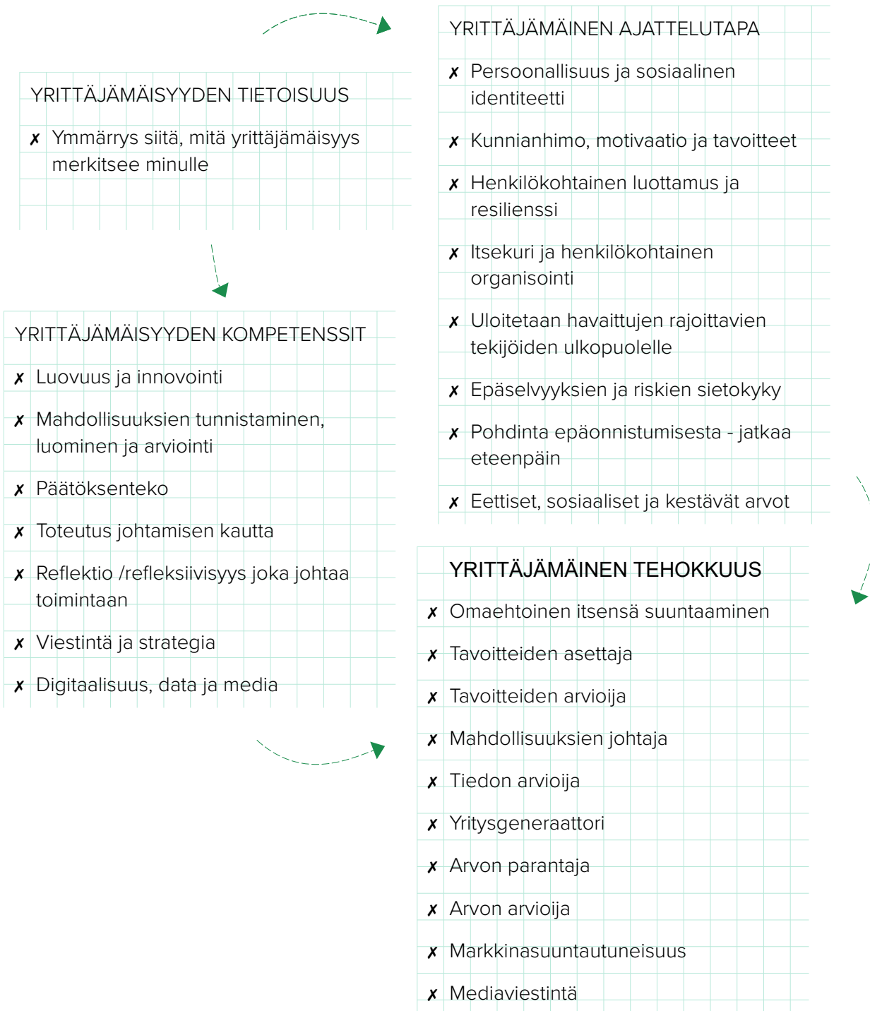
Kuva 1 (mukautettu QAA:sta, 2018)

Oppilaiden oppiminen ei välttämättä ole lineaarista; heillä ovat todennäköisesti erilaiset lähtökohdat ja tulevaisuuden näkymät; he voivat olla eri vaiheissa; tai he voivat osallistua samanaikaisesti erilaisiin oppimiskokemuksiin.