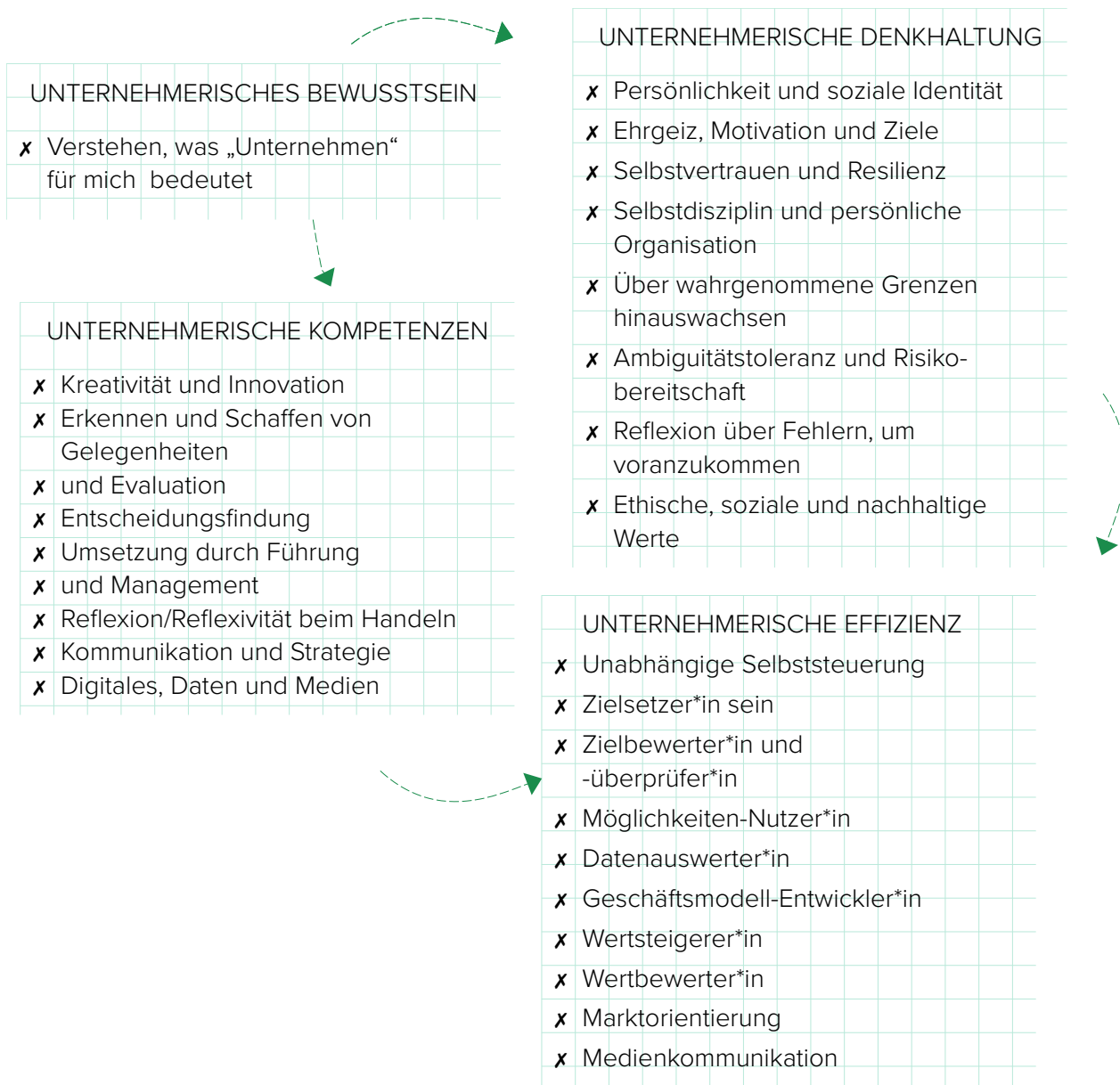
Abbildung 1 (angepasst aus QAA, 2018)

Lernende lernen nicht unbedingt linear. Ihre Lernwege haben wahrscheinlich unterschiedliche Ausgangspunkte und auch Übergänge in die Zukunft. Lernende können verschiedene Phasen iterativ durchlaufen oder gleichzeitig verschiedene Lernerfahrungen machen.